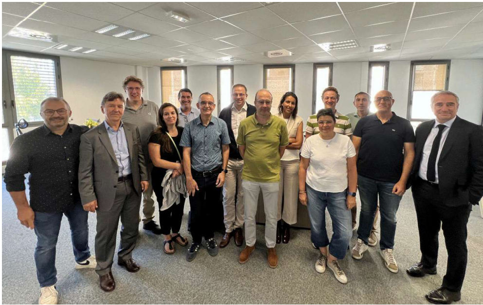
Agena 3000 a fait l'acquisition de Connectivia à Montréal, pour se déployer en Amérique du Nord

En septembre 2019, Agena 3000 fait l'acquisition de Connectivia, une société de 15 salariés qui fournit des solutions d'échange de documents utilisées par plus de 500 entreprises en Amérique du Nord. Elle est basée à Montréal, au Québec, où la famille Trichet s'installe. "Nous avons enfin ces références clients et nous avons pu peu à peu implanter nos propres solutions", poursuit Sébastien Trichet. Solutions développées par les équipes en France et en Tunisie, où Agena 3000 a ouvert un bureau fin 2018.